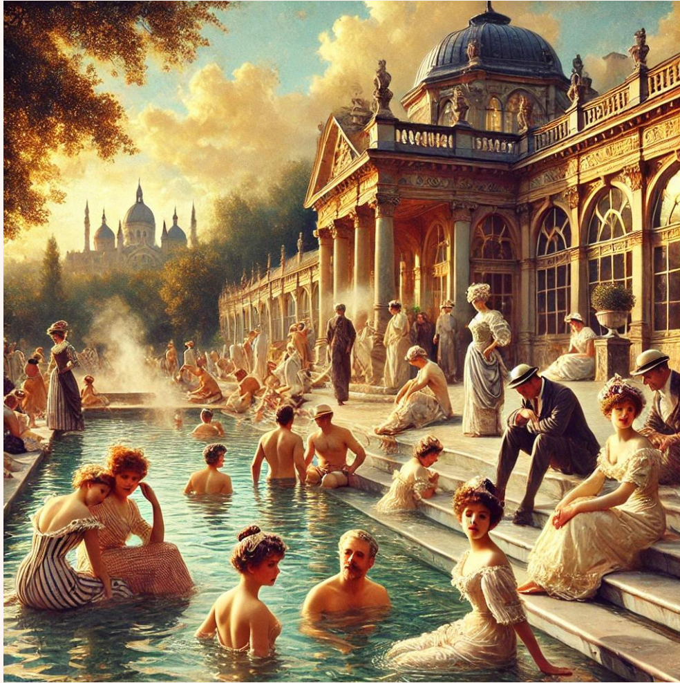
Bu görselde aristokratların 19. yüzyıl kaplıca kültürüne uygun şekilde yüzme kıyafetleriyle termal sularda bulunduğu bir sahne