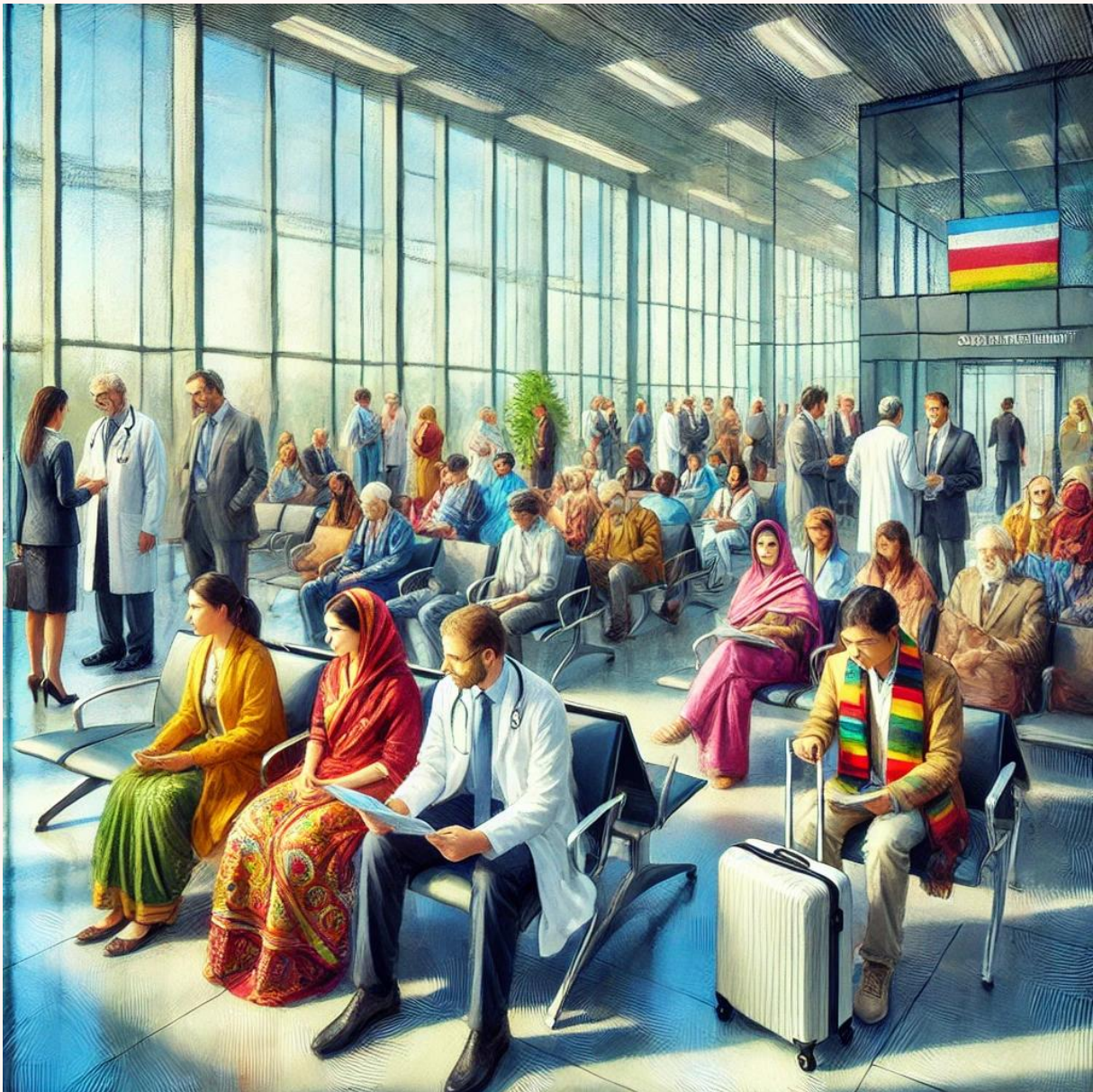
21. Yüzyılda Sağlık Turizmi; Modern bir hastanede yurt dışından gelen hastalar (Çok uluslu bir bekleme odasında tedaviye gelen insanlar)

Kaplıcalar ve fizik tedavi merkezleri, özellikle yaşlı nüfusun tercihi olmuştur.