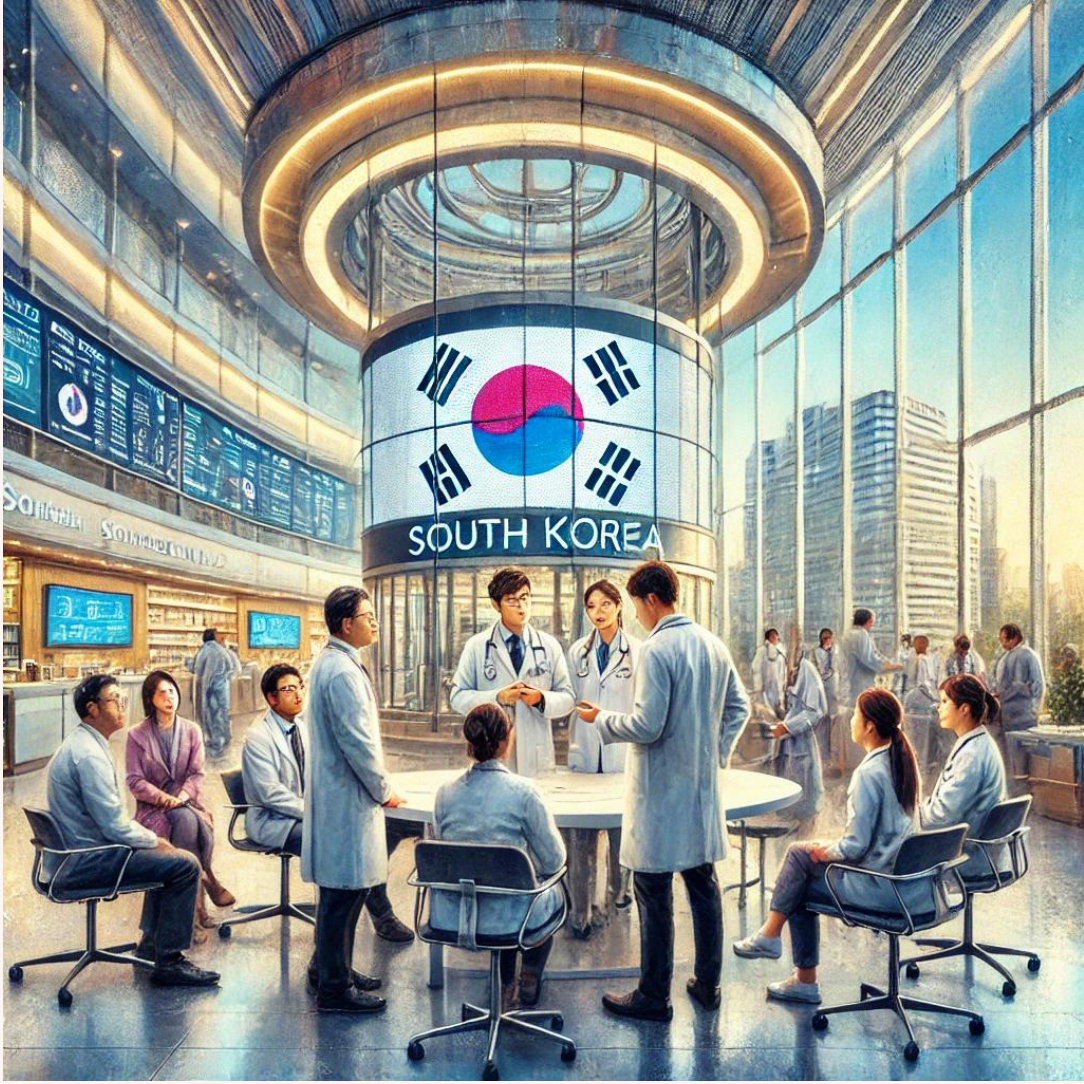
Güney Kore'de modern bir hastanede doktorlarla danışan yabancı hastalar