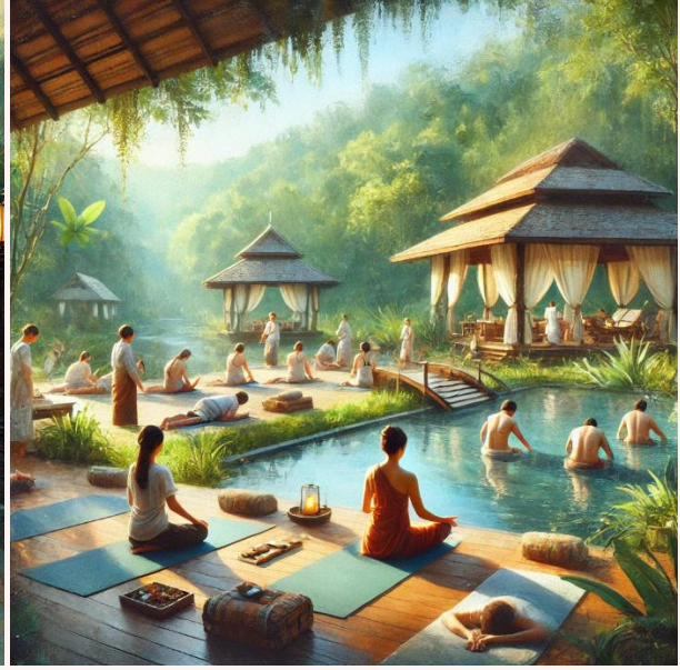
SOLDA: Bir termal havuzda sağlık turizmi yapan insanlar, SAĞDA: Doğal bir wellness merkezinde yoga ve spa hizmetleri alan turistler