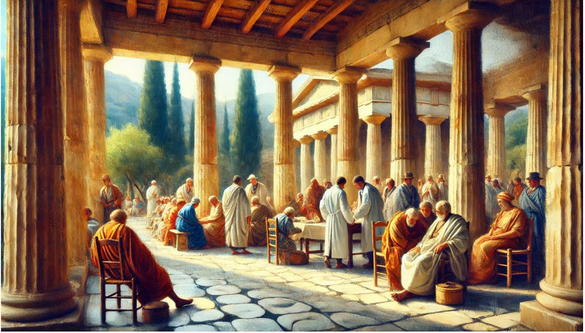
Antik Yunan'daki Asklepion şifa tapınağı, hekimler ve sağlık arayan insanlar

1. Giriş: Sağlık turizmi, bireylerin tıbbi tedavi, rehabilitasyon veya sağlıklı yaşam hizmetlerinden yararlanmak amacıyla ülkeler veya bölgeler arasında seyahat etmeleri olarak tanımlanır. Günümüzde küresel sağlık turizmi sektörü, milyarlarca dolarlık bir pazar haline gelmiş ve ülkelerin ekonomik büyüme stratejilerinde önemli bir yer edinmiştir. Çalışmada, sağlık turizminin tarihsel gelişimi, mevcut durumu ve geleceğe yönelik öngörülerini ele alınacaktır.