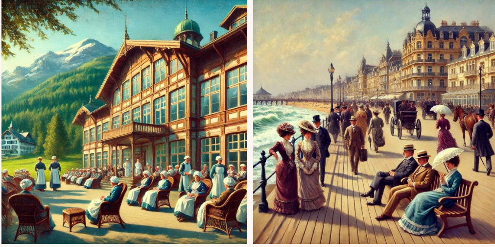
SOLDA: İsviçre Alplerin eteklerindeki bir sanatoryumda iyileşen hastalar. SAĞDA: Deniz kenarında sağlık için seyahat eden insanlar

3. Modern Dönemde Sağlık Turizminin Evrimi (18.-20. Yüzyıl): Sanayi Devrimi ile Avrupa'da kaplıcalar ve deniz kenarındaki sağlık tesisleri aristokrasi ve zengin kesimler için önemli hale geldi. 19. yüzyılda İsviçre'deki sanatoryumlar, solunum rahatsızlıkları olan hastalar için popüler destinasyonlardı.