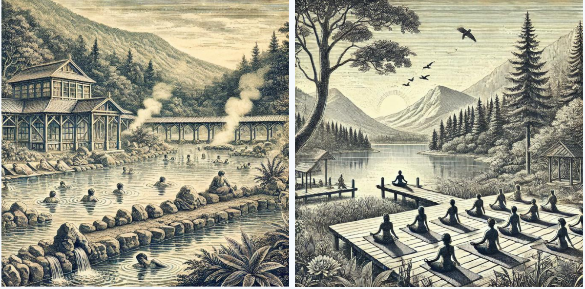
SOLDA: Termal Kaplıca ve Açık Hava Spa, SAĞDA: Doğada Meditasyon ve Yoga Alanı

Doğu'nun kesişim noktasında yer alan ülke, sağlık turizmi kapsamında sunduğu wellness ve spa hizmetleriyle uluslararası alanda rekabet gücünü artırmaktadır. Bu yazıda, Türkiye'de wellness ve spa turizminin sağlık turizmi üzerindeki etkileri, sektörün gelişimi ve geleceğe yönelik potansiyeli ele alınacaktır.